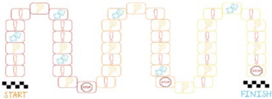
Schéma 2: Représentation du plateau de jeu

point d'interrogation, renvoie à un set de cartes présentant une situation qui requiert des participants et participantes qu'ils et elles fassent un choix entre deux options qui découlent de celle-ci, tout en tenant compte de leur évolution dans le parcours du jeu. Enfin, les cases « imprévu », symbolisées par deux dés, impliquent des participants et participantes qu'ils et elles vivent un coup du sort par la relance du dé.